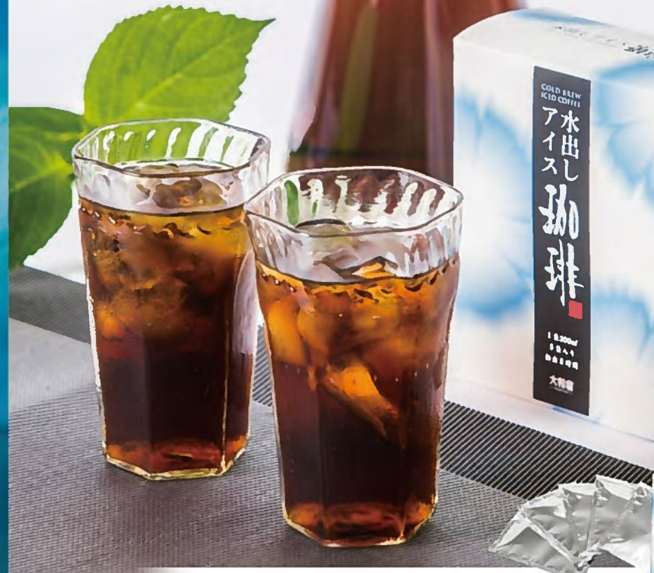
水出しアイス珈琲 1箱 700円+税 (13g×5袋/1袋 300ml用)

お家で簡単に作れる 水出しタイプのアイス珈琲。 水出しならではの まろやかさが特徴です。