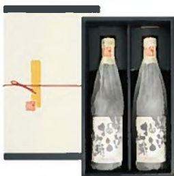
贅沢抽出珈琲 2本セット