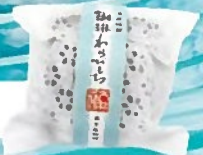
珈琲わらびもち 1個 250円+税 (黒きな粉付)