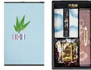
水出しアイス珈琲 A セット