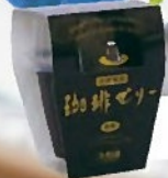
珈琲ゼリー 1個 303円+税 (コーヒーフレッシュ・ガムシロップ付)