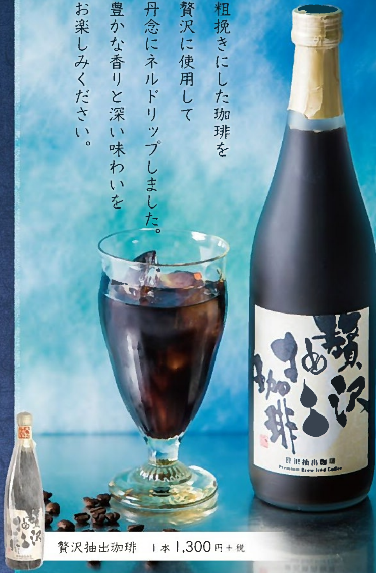
贅沢抽出珈琲 1本 1,300円+税

粗挽きにした珈琲を 贅沢に使用して 丹念にネルドリップしました。 豊かな香りと深い味わいを お楽しみください。