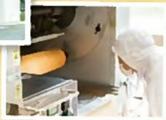
職人が一本一本 丁寧に焼き上げます