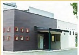
赤城山麓の 自社スイーツ工房

珈琲にこだわるからこそ、珈琲に合うお菓子をご提供したいという想いで、自社工房にて心を込めて一層一層焼き上げています。