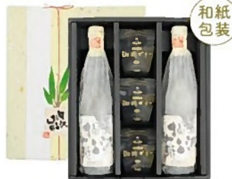
贅沢・寛ぎセット クール