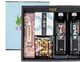
水出しアイス珈琲 B セット