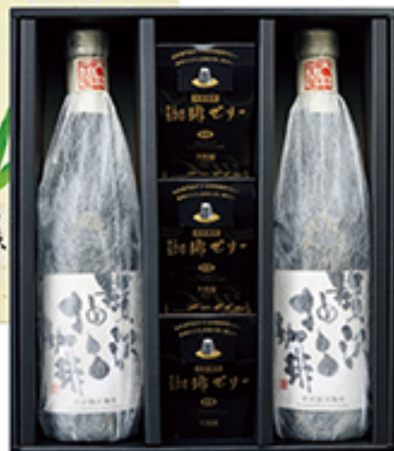
贅沢・くつろぎセット